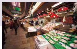
近江町市場 (徒歩 約5分)