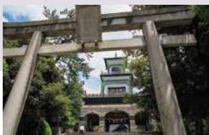
尾山神社 (徒歩 約5分)