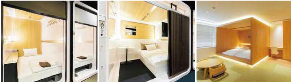
エコノミーポッド：定員1名