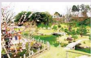
金沢城公園・玉泉院丸庭園 (徒歩 約14分)