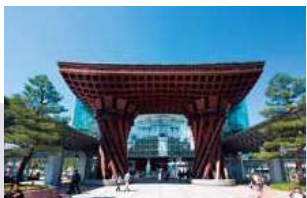
JR金沢駅(鼓門・もてなしドーム) (徒歩 約17分 / バスで 約6分)