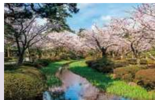
兼六園 (徒歩 約17分)